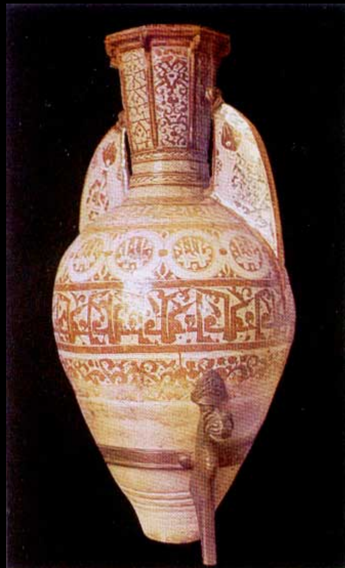
La céramique nasride. S.XIV