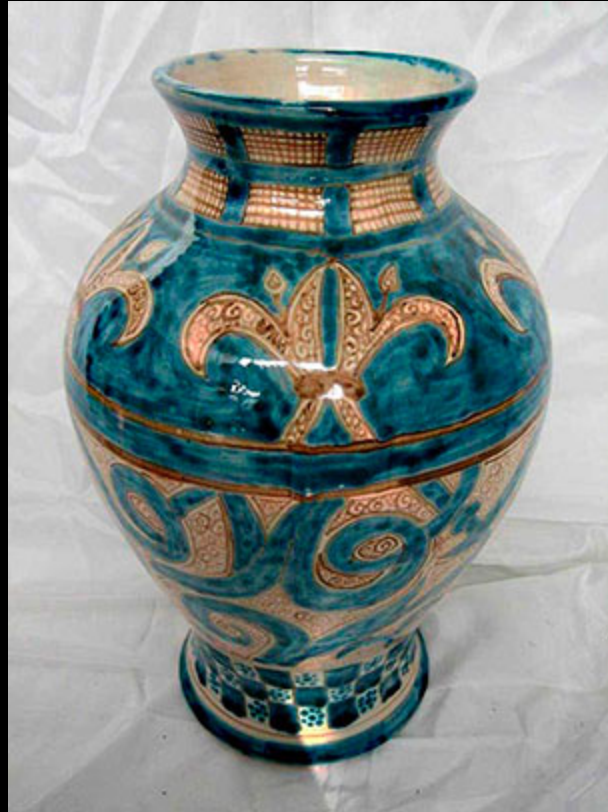
La céramique nasride. S.XXI