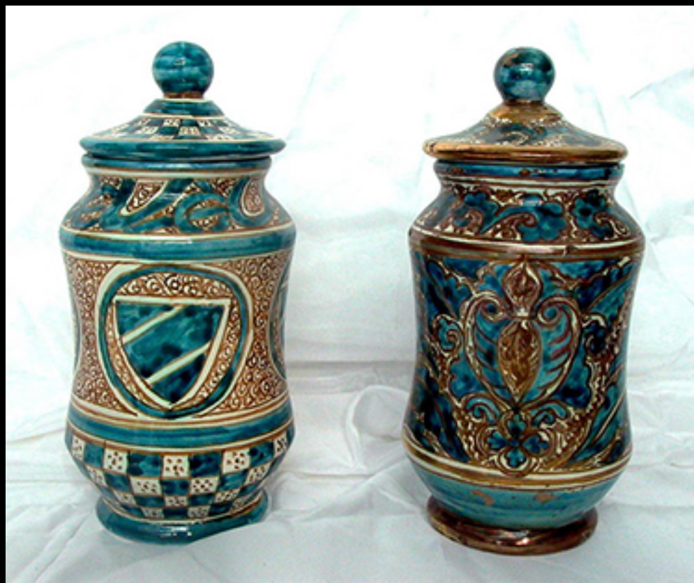
La céramique nasride. S.XXI