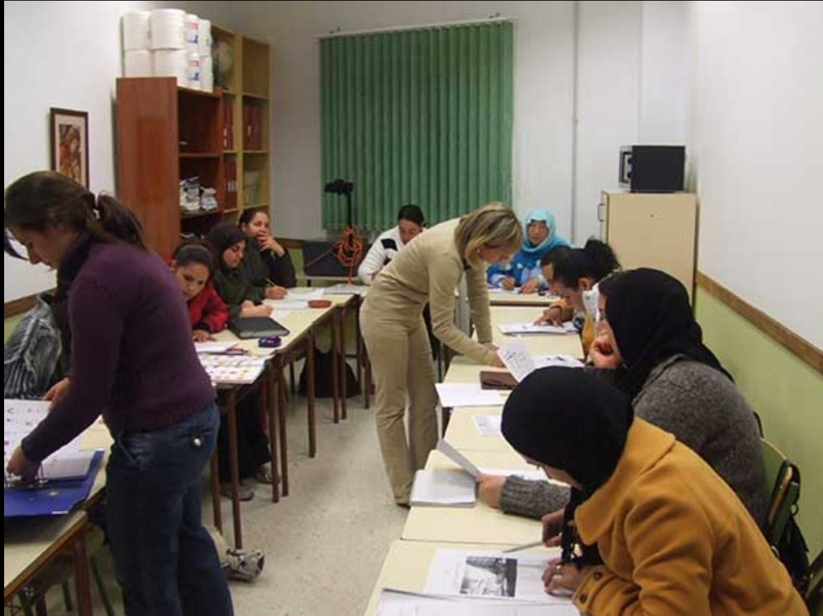
La formation interculturelle