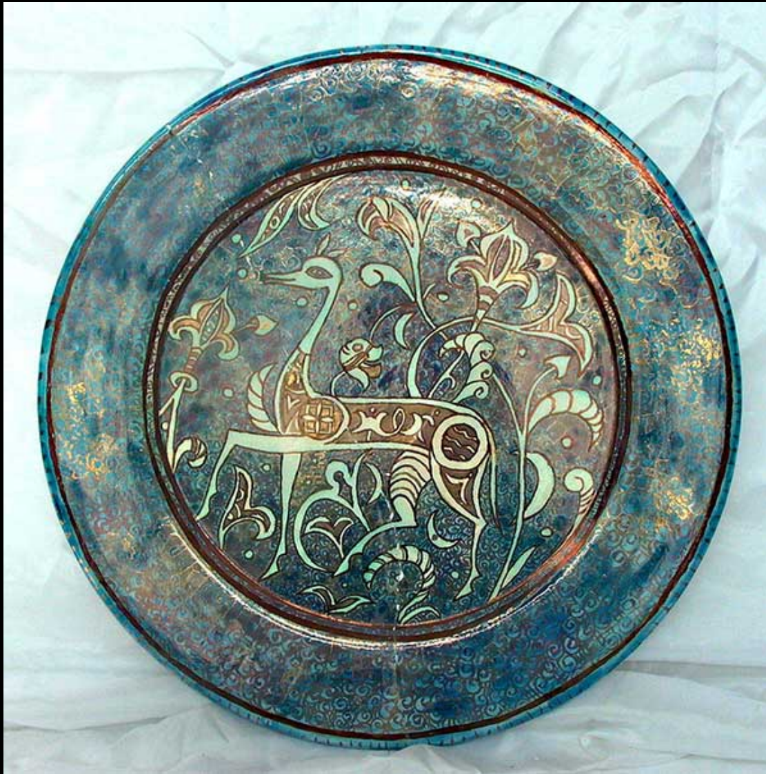
La céramique nasride et son évolution. S.XIV-SXXI