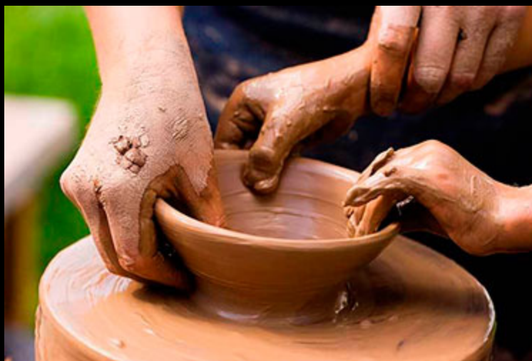
La céramique nasride. S.XXI. Atelier Casa de la Cultura Maracena