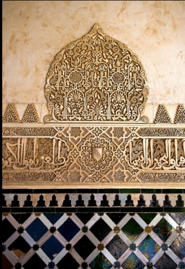
Les mathématiques et la ceramique dans les motifs végétaux de l'Alhambra