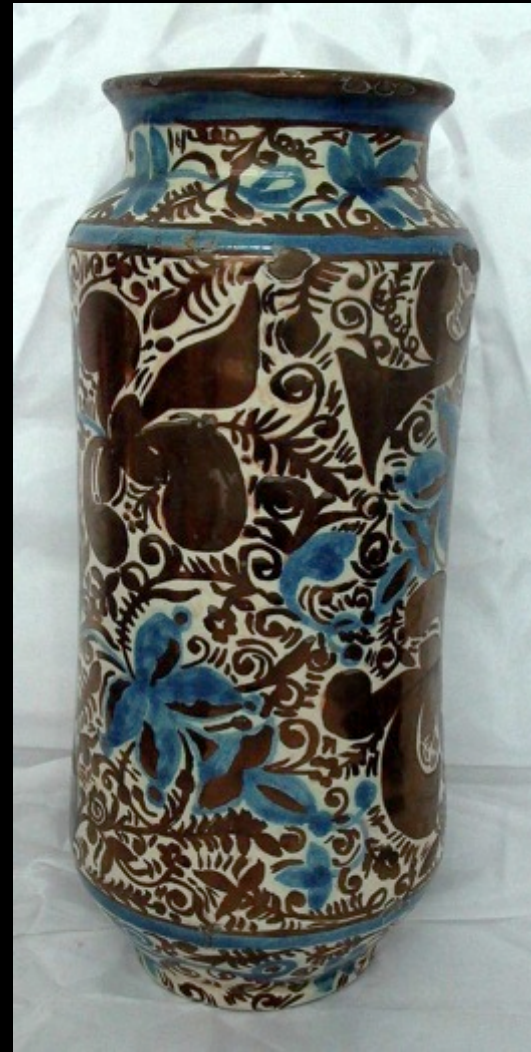
La céramique nasride. S.XXI