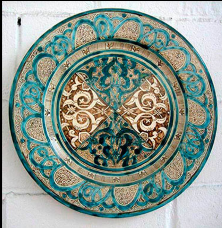
La céramique nasride et sa evolution. S.XIV-SXXI