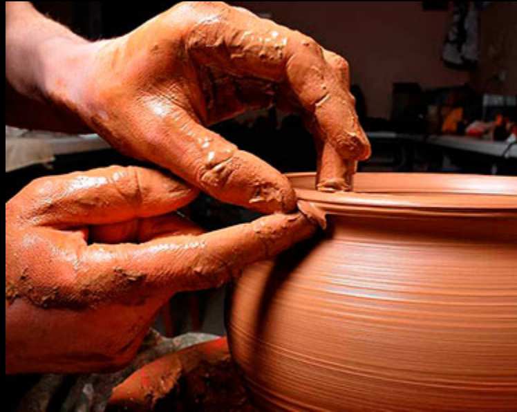
La céramique nasride. S.XXI. Atelier Casa de la Cultura Maracena