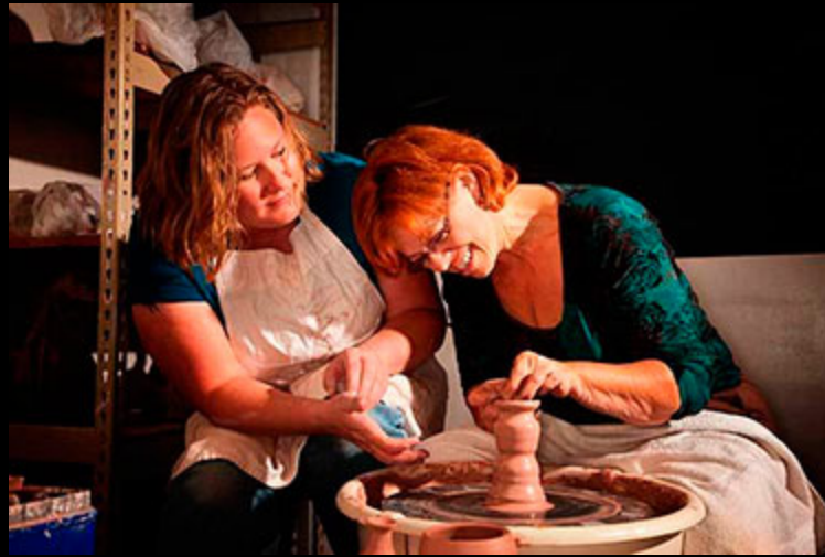
La céramique nasride. S.XXI. Atelier Casa de la Cultura Maracena