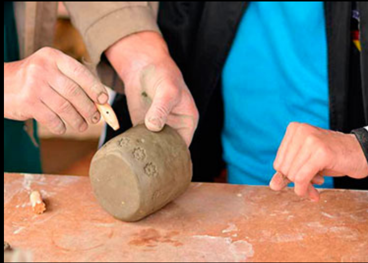
La céramique nasride. S.XXI. Atelier Casa de la Cultura Maracena