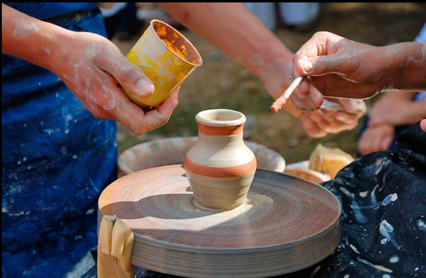
La céramique nasride. S.XXI. Atelier Casa de la Cultura Maracena