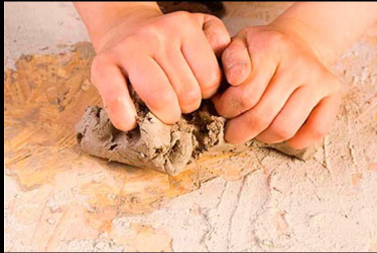
La céramique nasride. S.XXI. Atelier Casa de la Cultura Maracena