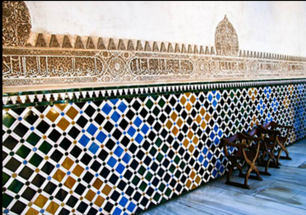
La mosaïque. S.XIV