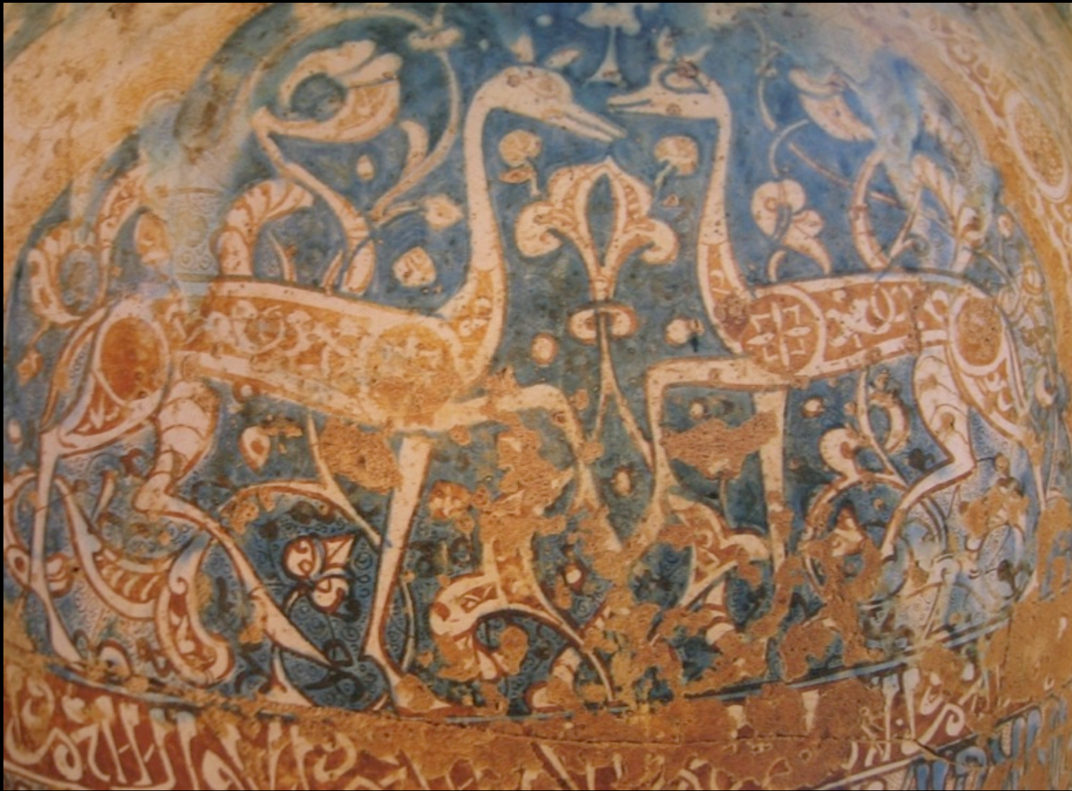
L'étude de l'art de la céramique, avec des motifs végétaux et son évolution historique.