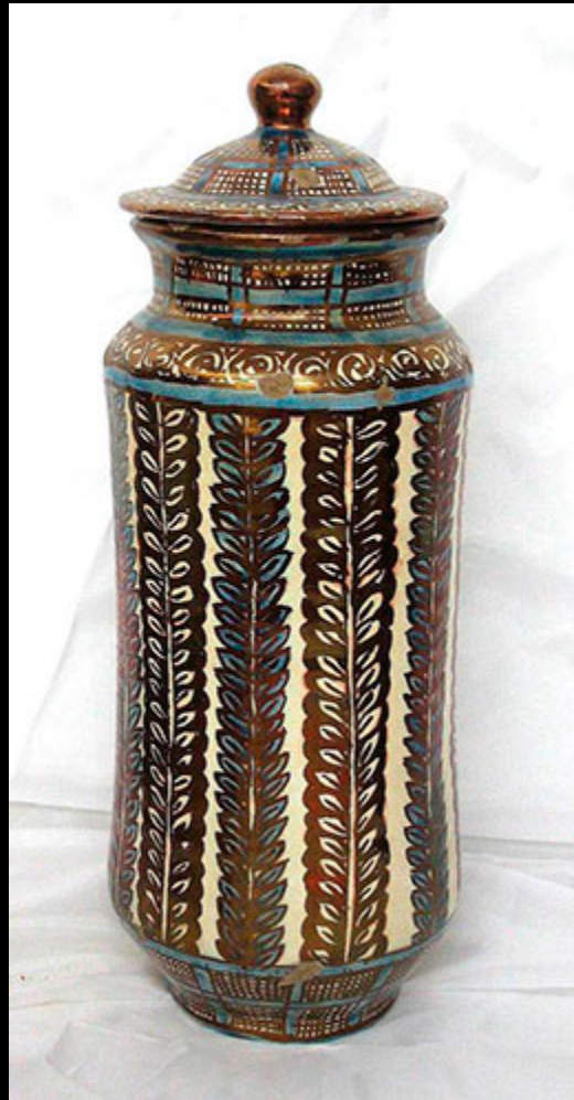
La céramique nasride. S.XXI