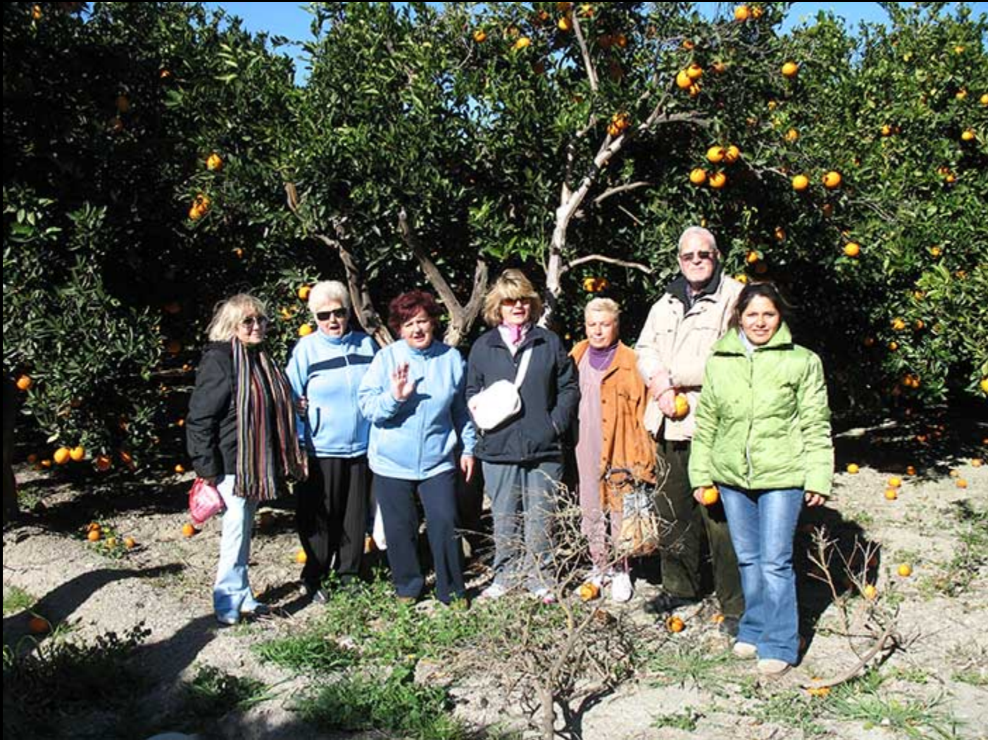
L'étude du paysage