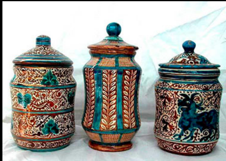
La céramique nasride. S.XXI