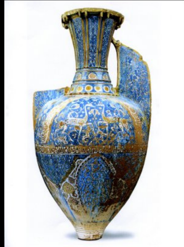
La céramique nasride. S.XIV