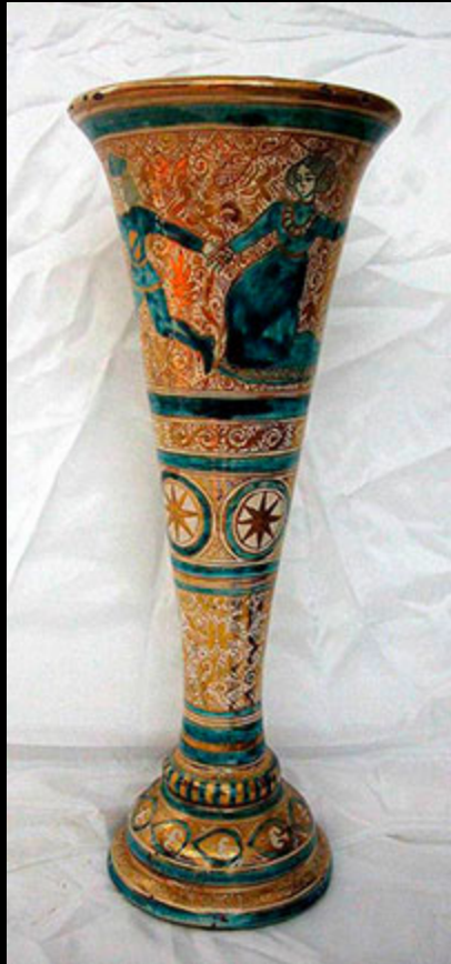
La céramique nasride. S.XIV