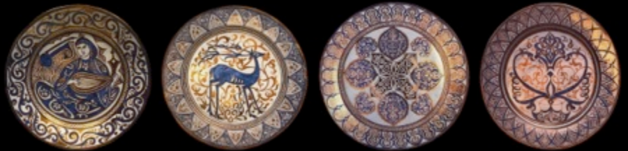
La céramique nasride et son évolution. S.XIV-SXXI