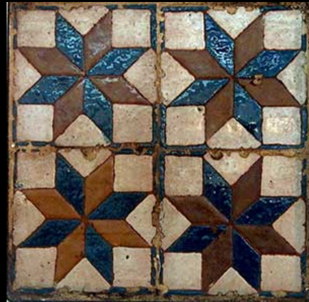
La céramique nasride. S.XXI